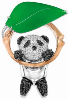
(圖左) 拍品編號 161

天然翡翠配鑽石「團團」胸針／吊墜，王進玲 估價：HK$ 38,000 - 58,000／US$ 4,850 - 7,400