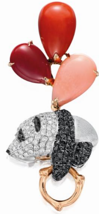
(圖右) 拍品編號 162

天然翡翠配鑽石「團團」胸針／吊墜，王進玲 估價：HK$ 38,000 - 58,000／US$ 4,850 - 7,400