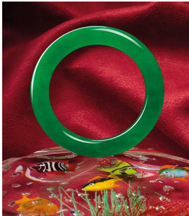
拍品編號 197 珍罕天然翡翠手鐲 估價待詢

香港，2018年5月8日 天成國際 2018 年珠寶及翡翠春季拍賣會將於 6 月 3 日舉行，薈萃各式渾然天成的彩色寶石、鑽石及翡翠珍品。重點拍品為一只滿綠的天然翡翠手鐲，飽滿瑩潤、種色兼備，為可遇不可求的上佳之品。天成國際今季蒐羅了 近 250 件瑰麗珍寶 ，琳瑯滿目，精彩可期。