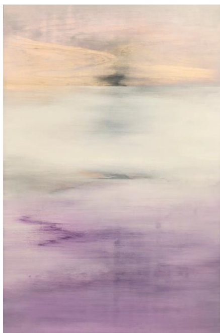
国松希根太《地平线之一》

平滞后」期，久未历经战争阴霾，价值观早已脱离泡沫经济时期虚无，作品也不像以往般反映战争和种族等沉重议题，这个时代的日本当代艺术家，偏巧与这个复杂的世界格格不入，也不愿意将自己的内心牵扯到无意义的挣扎中，所以留存至今的，就是最为自由、最为忠实于自己艺术世界观的作品，画意看似蜻蜓点水，实则沁人心扉。