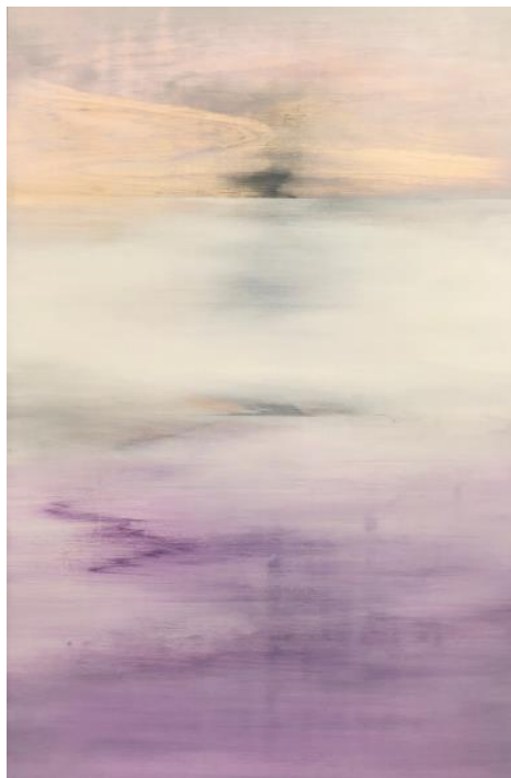
国松希根太《地平线之一》，压克力木板，2017年作，90 x 60 公分

(与天成国际2018年珠宝及翡翠春季拍卖预展同期登场； 5月24日起优先展览，敬请预约 )