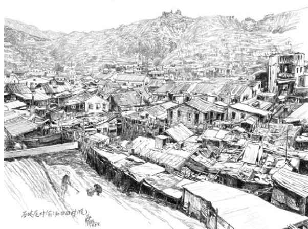
江啟明《西環太白台》

江啟明筆下的景物，很多已被時代巨輪吞噬，石硤尾便是其中之一。此幅素描創作於 1953 年，剛好是同年聖誕夜石硤尾寮屋區大火發生之前。當晚，石硤尾白田村有住戶燃點火水燈時燒着棉胎，由於房子設計簡陋，加上以木材製作，火勢乘風迅速蔓延。大火波及多個木屋區，逾 2,500 間木屋燒毀，5 萬多名居民頓失家園。時至今日，石硤尾邨已演變成新一代的公營房屋。江啟明以敏銳的觸角融情入景，實在地表現出六十多年前石硤尾的一景一物，細緻如田地裡耕作的農人，亦刻劃得絲絲入扣，歷史盡現眼前。