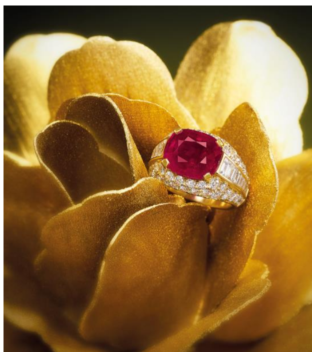
8.06 克拉天然緬甸抹谷無經加熱處理「鴿血紅」紅寶石配鑽石戒指，Bulgari 出品

估價：HK$ 3,500,000 – 4,500,000 / US$ 450,000 – 577,000