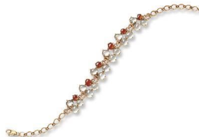
天然冰種翡翠蛋面配紅翡翠蛋面鑽石戒指及手鍊 估價：HK$ 40,000 - 60,000 /US$ 5,200 - 7,800