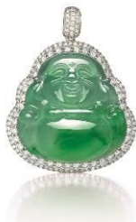
天然冰種翡翠及翡翠鑽石「彌勒佛」一對 估價：HK$ 100,000 - 150,000 /US$ 13,000 - 19,500