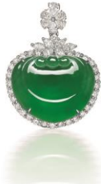
天然翡翠「如意」鑽石掛墜 估價：HK$ 120,000 - 180,000 /US$ 15,500 - 23,500