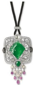
天然翡翠「如意」配冰種翡翠及各色寶石掛墜 估價：HK$ 80,000 - 120,000 /US$ 10,500 - 15,500