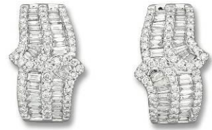
鑽石耳環 估價：HK$ 25,000 - 35,000 /US$ 3,300 - 4,500