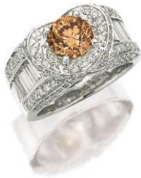
1.50 克拉圓形啡色鑽石配鑽石戒指 估價：HK$ 25,000 - 36,000 /US$ 3,300 - 4,600

天成國際本季為藏家帶來逾 60 件「無底價」珠寶拍品。從精緻無色冰種、綠色及紅色翡翠至各色瑰麗寶石、鑽石，甚至精緻翡翠中國象棋及棋盤擺件，我們都致力以最相宜的價格，呈獻最優質的珠寶美物。