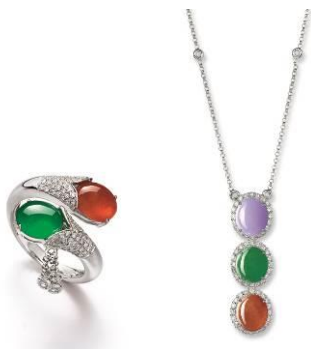
天然三色翡翠蛋面鑽石掛墜項鍊及戒指 估價：HK$ 80,000 - 120,000 /US$ 10,500 - 15,500