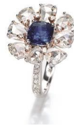
1.85 克拉枕形天然無經處理藍寶石鑽石戒指 估價：HK$ 30,000 - 45,000 /US$ 3,900 - 5,900